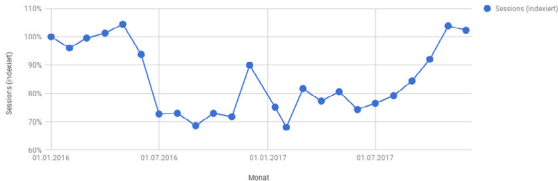
Sessions (indexiert) und Monat

Durch die Aktivierung der Bing-Kampagnen per Januar 2017 steigen die insgesamt über Bing gemessenen Sessions von Januar bis Dezember 2017 gegenüber dem Vorjahreszeitraum um 38 Prozent.